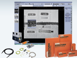
공업용 X-ray, 필름, 디지털 영상